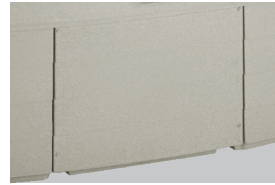
Panel de la puerta