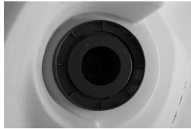
Compartiment du filtre